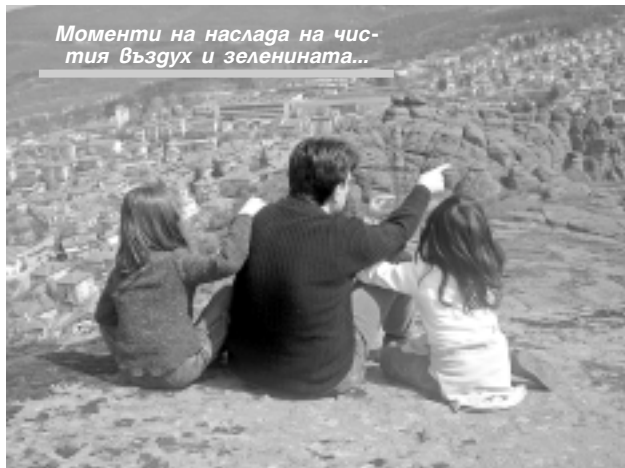
Моменти на наслада на чистия въздух и зеленината...

В късния следобед на 2 април пристигнахме в удивително красиво място - подножието на Белоградчишките скали. В Белоградчик църквата е малка, но хората са много мили и задружни! Посрещнаха ни топло и бяха направили така, че да ни е максимално удобно и уютно. Всички се