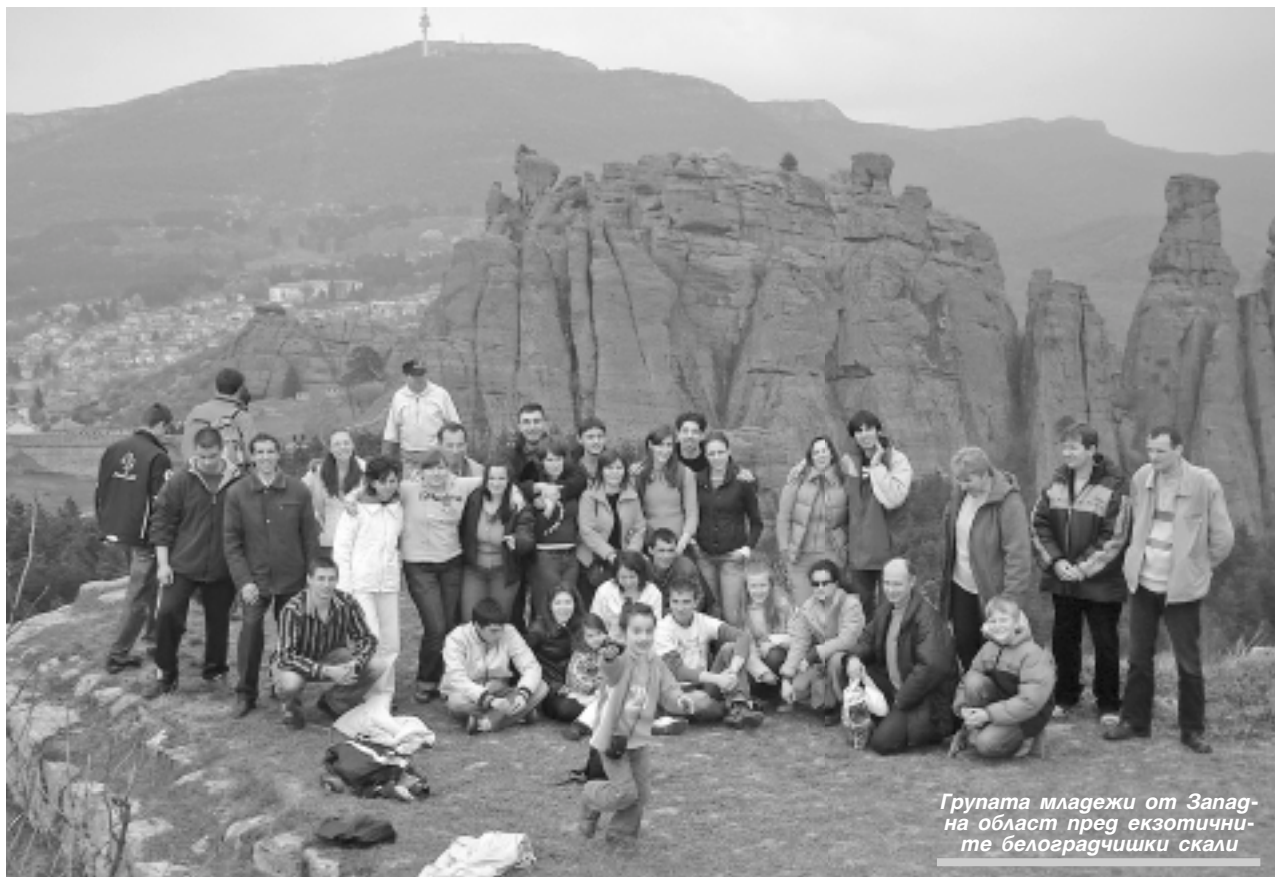
Групата младежи от Западната област пред екзотичните белоградчишки скали