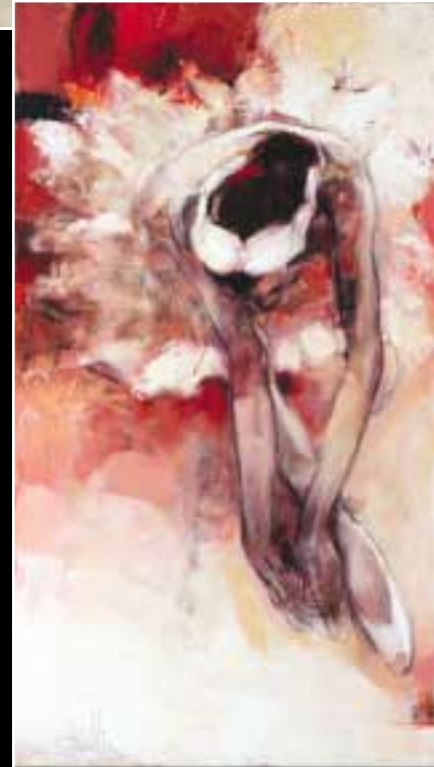
„Подготовка за танц“