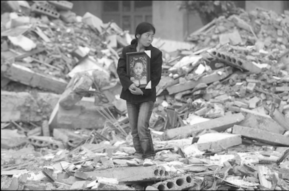
Майка сред руините на училището, погребало сина ѝ.